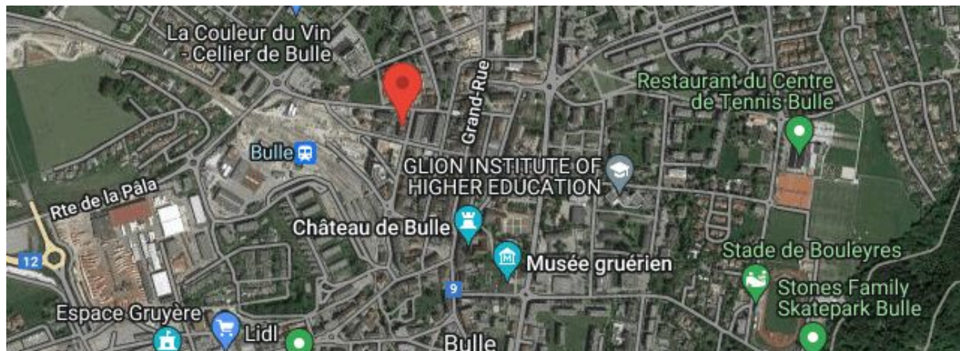
Plan de situation